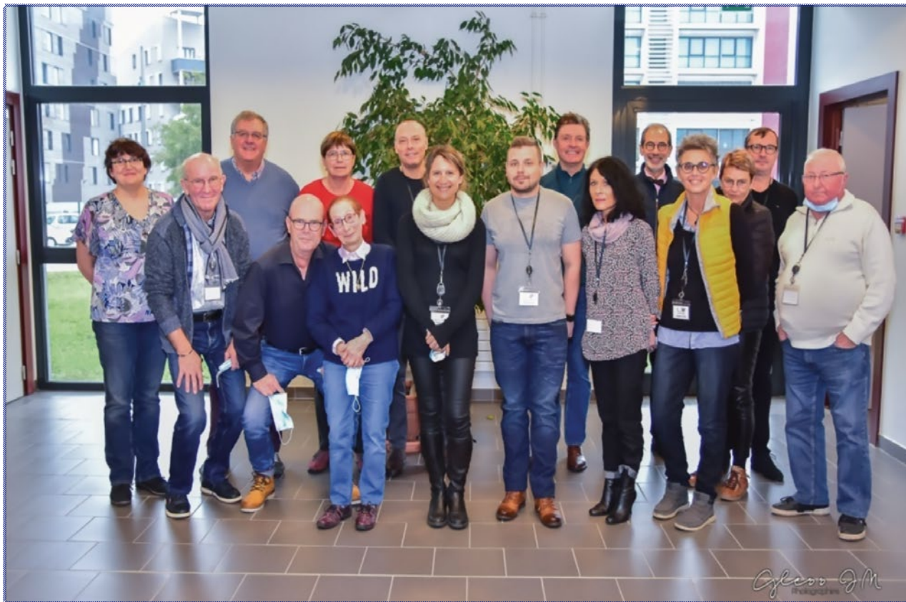
Formation des Stomisés-contact en 2021