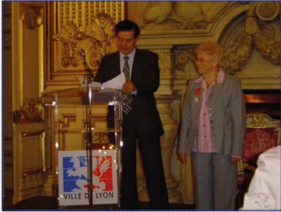
Communément appelées (és) Stomathérapeutes

Elles (ils) sont infirmières (ers) Diplômées (és) d'Etat qui ont suivi une formation spécifique et diplômante agréée par l'A.F.E.T. et le World Conclil of Enterostomal Therapists (W.C.E.T.)